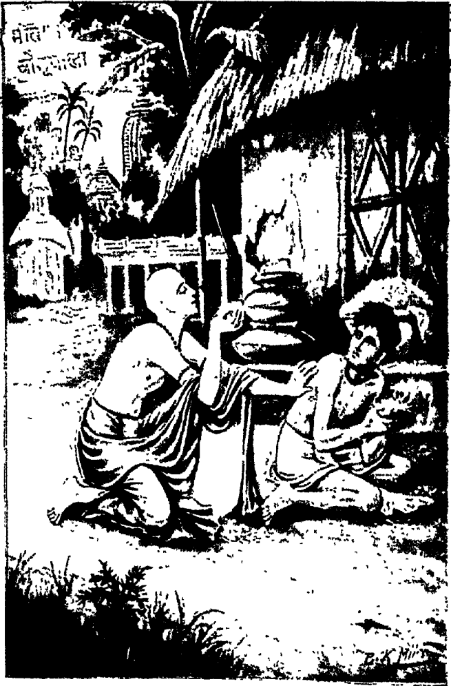
भक्त रघुनाथदास और श्रीचैतन्य